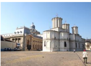
Berca 📍 🚗 130km - ⌚ 2h Bucarest 📍