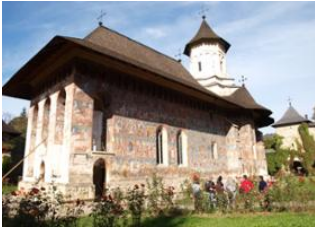
Agapia 📍 🚗 160km - ⌚ 3h Agapia 📍