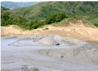
Agapia 📍 🚗 300km - ⌚ 4h 30m Berca 📍